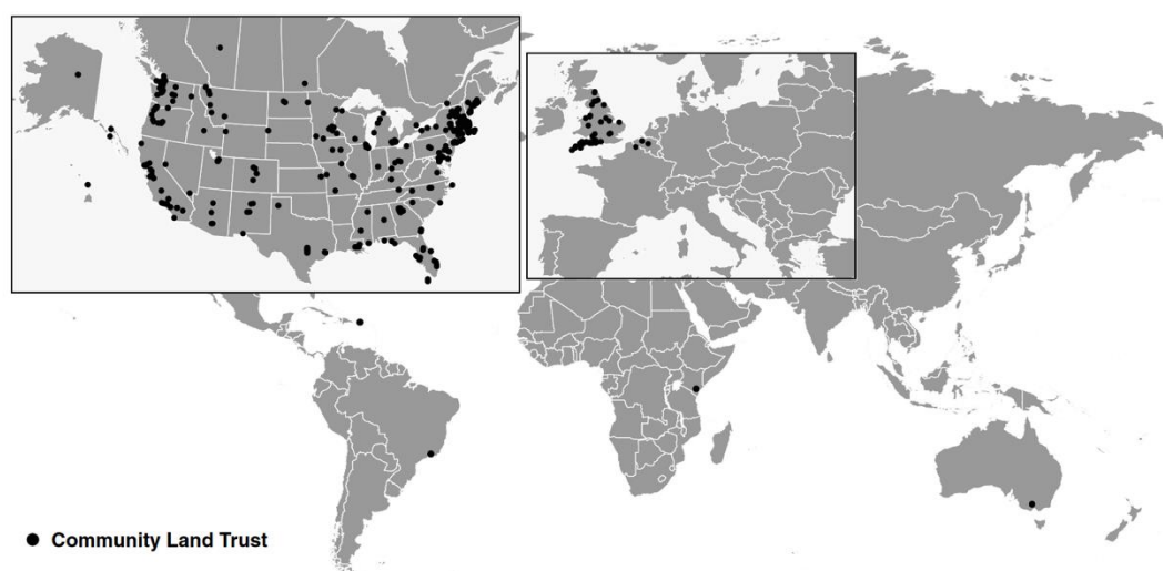
Mapa 1. Community Land Trusts no mundo