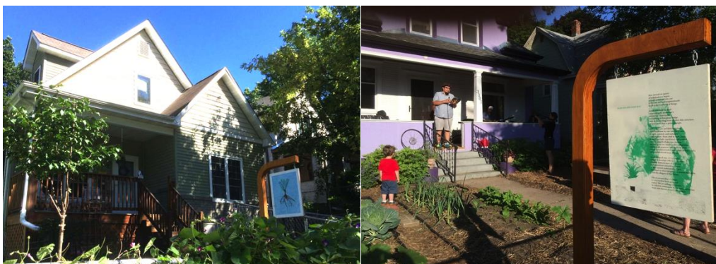
Figura 3. Cartazes do projeto "esta casa não está à venda"

residentes, onde todos compartilharam histórias sobre o uso de suas casas, e o que ter uma casa significava para cada um deles. Esses eventos envolveram leituras de poesia, música, comida e atividades pensadas para integrar tanto os moradores do CLT, quanto os vizinhos do entorno. As histórias compartilhadas foram então transformadas em cartazes, parecidos com os anúncios de imobiliárias, e colocados em frente às casas como forma de protesto (DEFILLIPIS et al. , 2019).